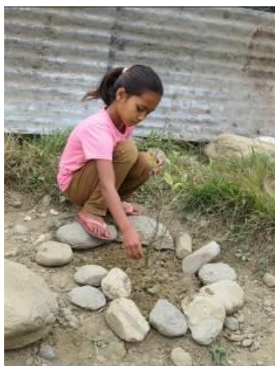
Potager : ça démarre !